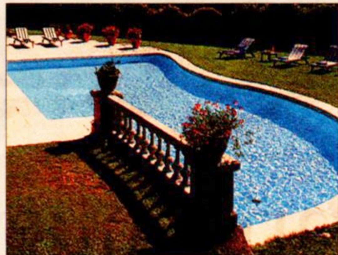
A la izquierda, el Relais & Chateau Torre de Remei, el Lérida. Sobre estas líneas y a la izquierda, el R&C Mas de Torrent (Gerona).