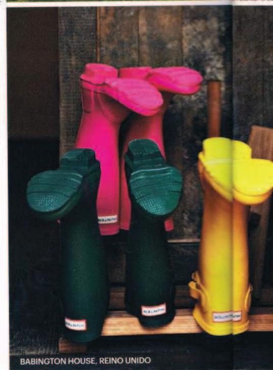
BABINGTON HOUSE, REINO UNIDO