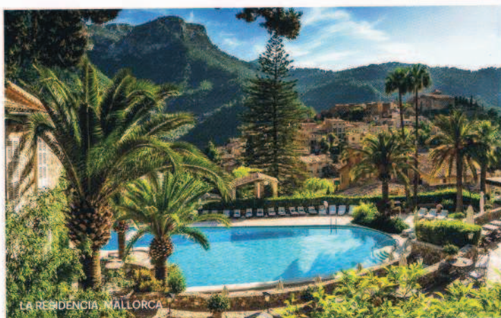
LA RESIDENCIA, MALLORCA

Casonas, palacios, castillos, cabañas, haciendas... Descanso, naturaleza y buenos alimentos. Refugios de desconexión de nuestra rutina moderna, un par de días en ellos y estamos recuperados de los males urbanos. Puede que no tengan las instalaciones de un resort pero la gastronomía suele ser un plus.