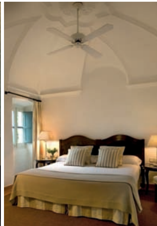
El Mas Spa cuenta con piscina climatizada, sauna, solarío... Las Margaritas, una de las diez lujosas suites con nombre de flores que crecen en los jardines.