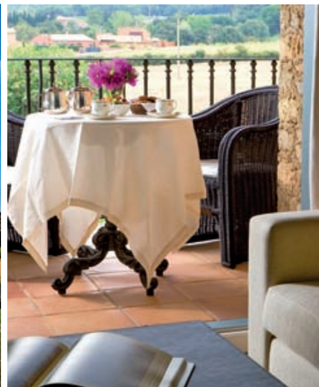
Sobre estas líneas, fachada principal, una antigua masía del siglo XVIII. A continuación, una de las suites con terraza para disfrutar de unas espectaculares vistas.