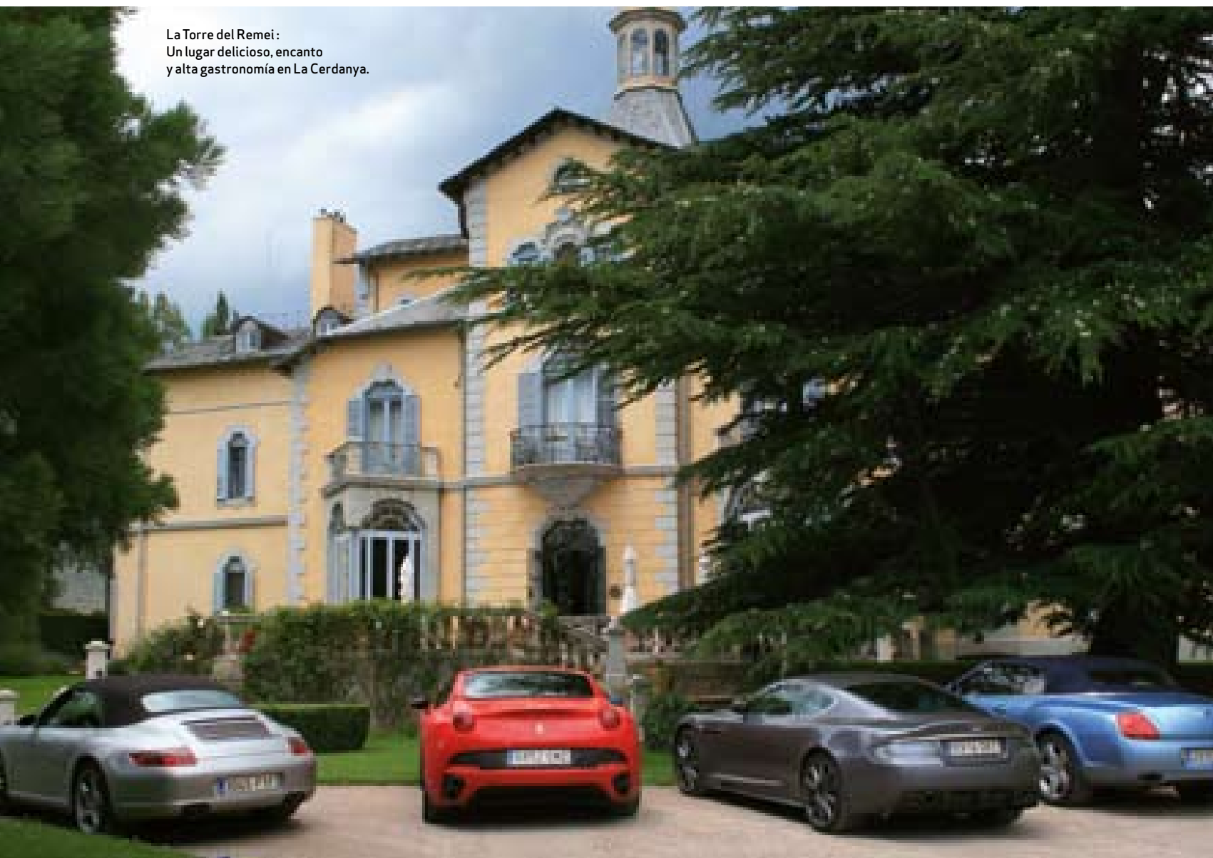
La Torre del Remei: Un lugar delicioso, encanto y alta gastronomía en La Cerdanya.