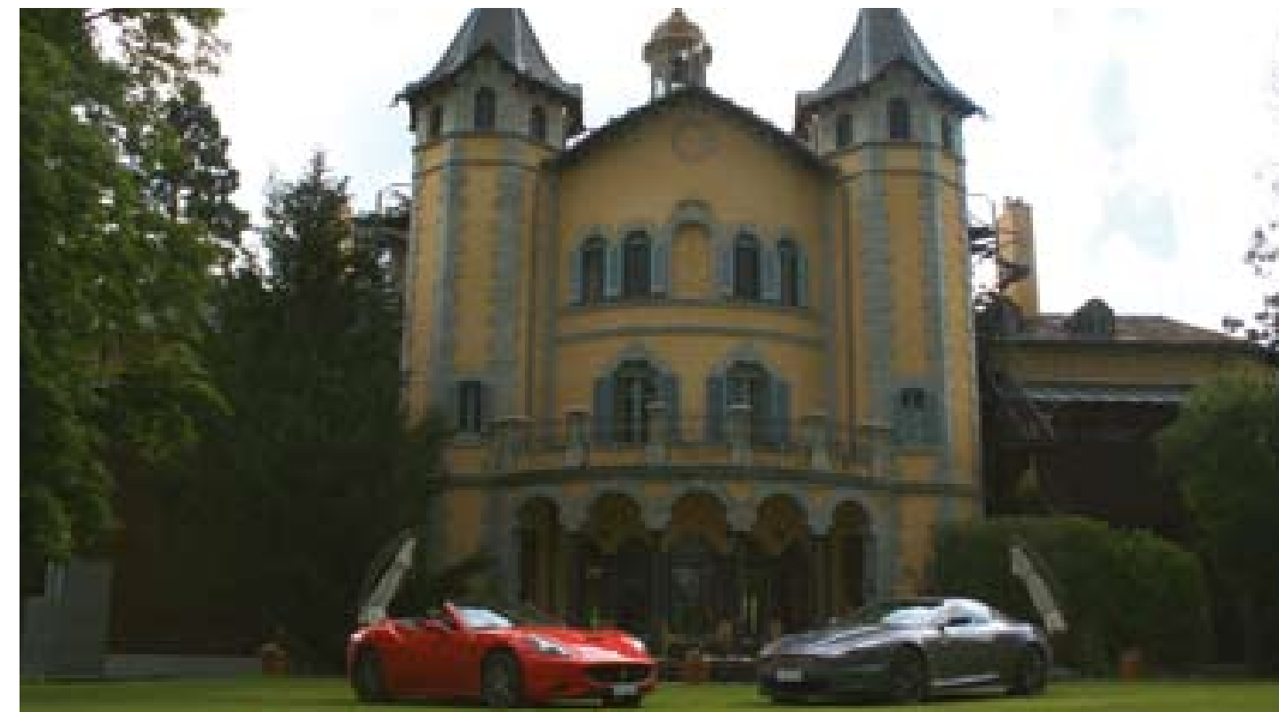
El Hotel & Spa de Mas de Torrent, en el Empordà.