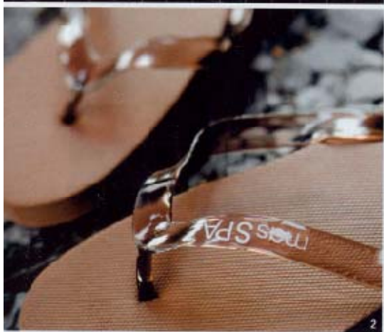
1. ESCALERA: de roble y hierro, con barandillas de cristal, diseñada por Cuca Arraut, con iluminación por leds de Lightled. Las luminarias de Rancem Light de Miroñi fueron adquiridas en Biosca & Botey. 2. ZANQUILLAS: de plástico, con el logo del hotel. Las huéspedes las reciben al llegar al hotel. 3. RESTAURANTE: con techo de vigas de madera proyectado por Damían Ribas, las mesas y sillas son de Dedon.