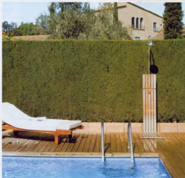
1 Y 2. SUITE: el mobiliario es diseño de Cuca Araut, realizado por Carpintería Rocas, como la cama de roble decapado; paredes revestidas con rafia de Cottlin; pavimento de roble de Comercial de Moquetas; lámparas de lectura Tolomeo de Artemide y de suspensión de Ca2L y butaca de Tapicería Aranda. 3. PISCINA: exterior, revestida con madera y mosaico azul.